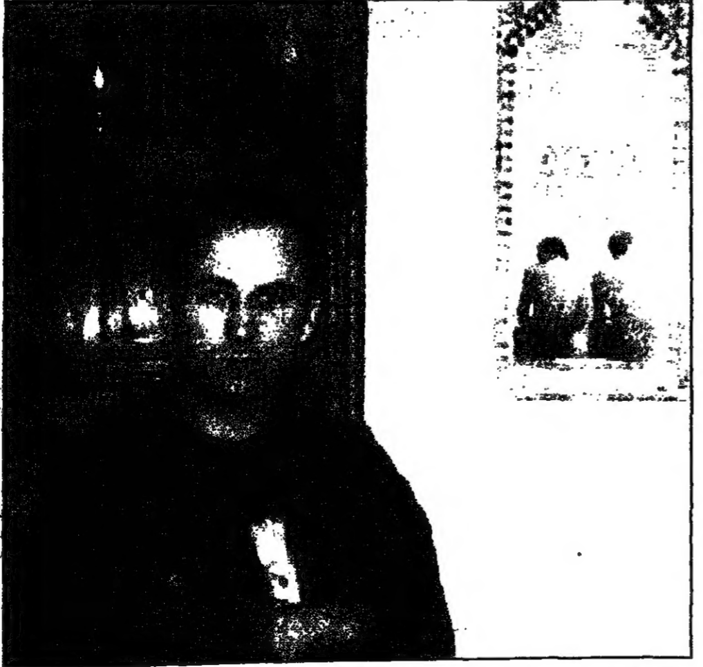
للخرج خوزن اوزبكي